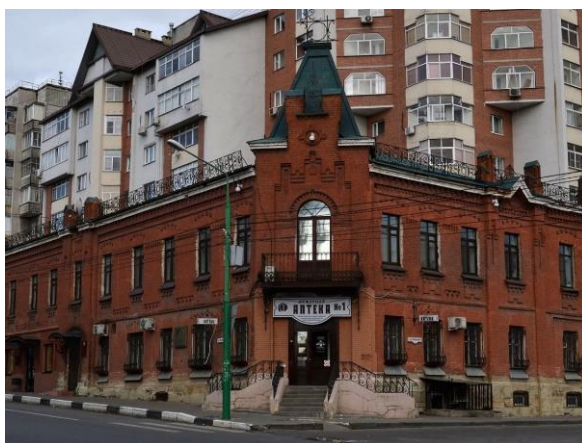
Рис. 2. Здание аптеки провизора Э.Е. Карстенса

красного кирпича, имеющее необычную форму «утюжка», до сих пор сохранилось (рис. 2).