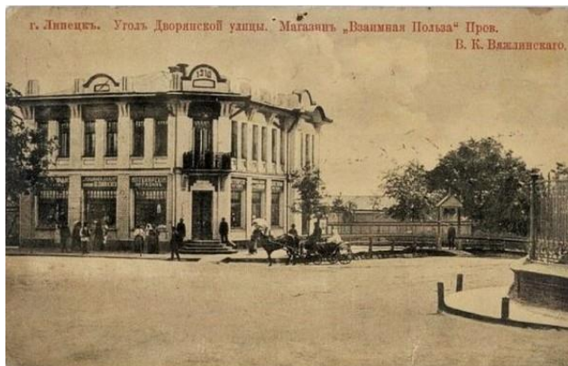
Рис. 3. Здание Аптеки провизора В.К. Вяжлинского

улица Ленина) превосходный особняк (рис. 3).