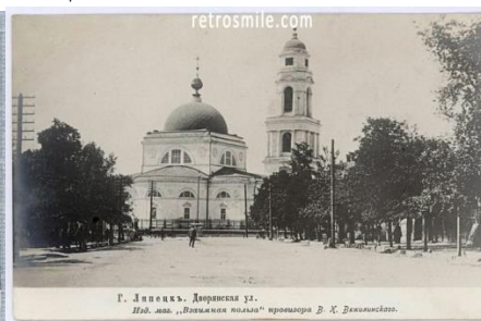
Рис. 7. Открытки с видами города, продававшиеся в магазине В.К. Вяжлинского

Аптекарское дело является особым видом предпринимательства, связанным с продажей лекарственных средств и медицинской продукции. Основными задачами аптекарского дела является обеспечение населения доступными и качественными лекарствами, соблюдение правил хранения и продажи лекарственных средств, а также предоставление квалифицированной консультации по их применению. В период с середины XIX до начала XX в. аптечное дело играло важную роль в провинциальной экономике. Фармация была неотъемлемой частью здравоохранения и бизнеса в дореволюционной России. В течение данного времени наблюдалось увеличение числа аптечных учреждений и их сотрудников.